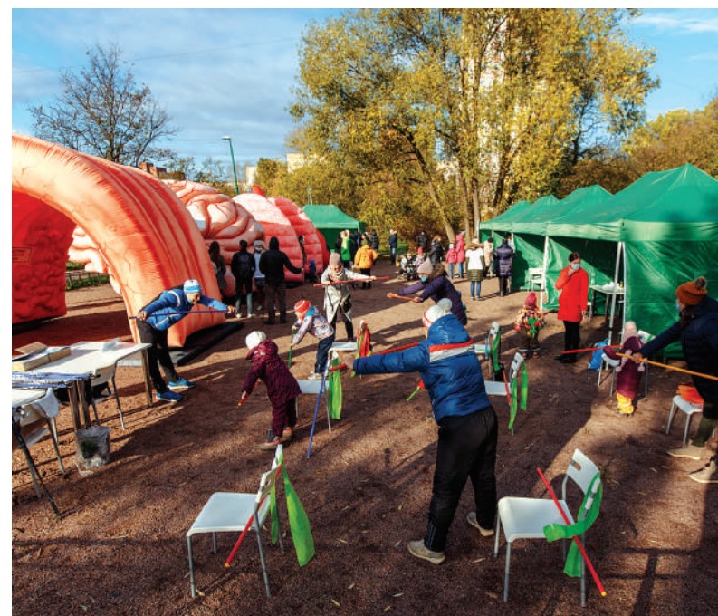
Акция «Территория здоровья»

Акции в рамках кампании «Территория здоровья» прошли еще в трех районах Санкт-Петербурга.